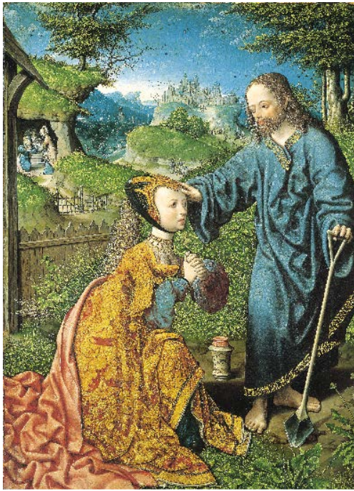
Afbeelding 2: Jacob Cornelisz van Oostsanen, Noli me tangere , 1507, olieverf op paneel, 54,5 x 39 cm, Staatliche Museen, Kassel.

en nauwkeurige werkwijze. Het paneel kent bovendien een enorme rijkdom aan verhalende details die de verteller in Jacob naar boven brengt. Hoewel de renaissance in de Nederlanden nog even op zich liet wachten, illustreert dit schilderij met haar gedetailleerde stofuitdrukkingen en verhalende details op doeltreffende wijze dat Jacob goed wist wat er speelde in Italië en dat hij zich op een scharnierpunt tussen de middeleeuwen en de renaissance bevond.