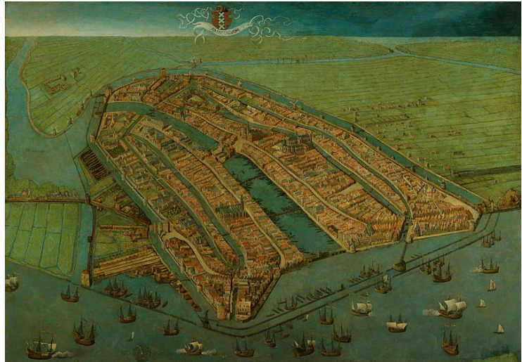
Afbeelding 5: Cornelis Anthonisz, Amsterdam in vogelvlucht , 1538, olieverf op paneel, 116 x 159 cm, Amsterdam Museum, Amsterdam.

In het Amsterdam Museum staat het Amsterdam van Van Oostsanen centraal; de kunstenaar wordt in de context van zijn tijd geplaatst. In de vroege zestiende eeuw tekenden de vele kerken, kloosters én pelgrims de katholieke stad waarbij de opkomende burgerij een nieuwe machtsfactor werd. Het Mirakel van Amsterdam maakte dat de stad zou uitgroeien tot een belangrijk bedevaartsoord. In de tentoonstelling wordt daarnaast aandacht besteed aan het succesvolle atelier van Van Oostsanen en zijn clientèle, maar ook aan zijn directe nazaten Dirck Jacobsz en Cornelis Anthonisz.