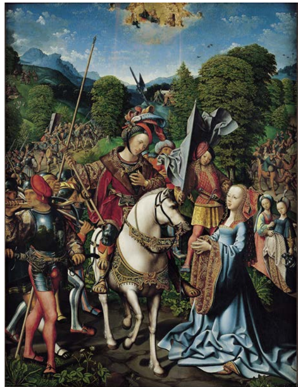
Afbeelding 1: Jacob Cornelisz van Oostsanen, David en Abigail , ca. 1507-1508, olieverf op paneel, 87 x 67,5 cm, Staatens Museum for Kunst, Kopenhagen.

Deze schildertechnische perfectie geldt tevens voor Noli me tangere (afb. 2). Het schilderij kent een extreme detaillering; zo zijn er minieme konijntjes weergegeven zo klein als speldenknopjes en zijn alle planten identificeerbaar, dankzij Van Oostsanens precisie