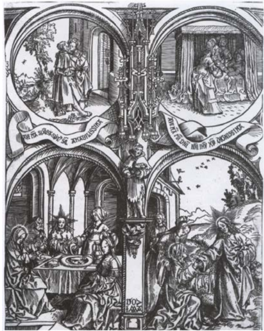
Afbeelding 4: Jacob Cornelisz van Oostsanen, Marialeven (blad 2 van de oorspronkelijk 7), 1507, houtsnede, 35 x 25,5 cm, Rijksmuseum Amsterdam.

Het vakmanschap van Van Oostsanen beperkte zich niet tot alleen schilderijen. Hij vervaardigde ook, houtsneden, tekeningen en gewelfschilderingen in kerken. Daarnaast maakte Jacob ontwerpen voor gebrandschilderde glasruitjes en voor borduurwerk op liturgische gewaden. Deze ontwerpen baseerde Jacob vaak op zijn eigen houtsneden. In dat kader zijn ook de zogenaamde reuzenhoutsneden zeer bijzonder. Het was destijds een spectaculair nieuw medium, waarbij van meerdere houtblokken gedrukte bladen aan elkaar werden gemonteerd tot één ensemble. Het vroegst bekende voorbeeld hiervan is het Marialeven uit 1507 (afb. 3). Deze reeks bestond uit zeven verschillende prenten – waarvan er zes bewaard zijn gebleven – die tezamen een ‘papierene tapijt’ vormen. Vanwege de kwetsbaarheid van de bladen zijn de meeste exemplaren in de loop der tijd verloren gegaan. Des te uniek én bijzonder is het dat deze prachtige reeks voor de eerste keer, dankzij de welwillendheid van diverse Europese prentcollecties, in oorspronkelijke vorm zal worden tentoongesteld. Dergelijke reeksen waren als educatieve wanddecoratie bedoeld voor in kloosters, grote woonhuizen, en waarschijnlijk ook in scholen.