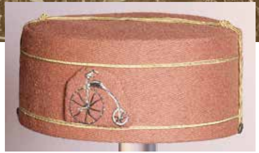
Pet 2: Herenpet (1884). Museum Rotterdam