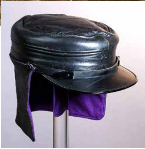
Pet 1: Stokerspet (ca. 1900)