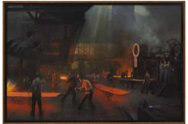
Werken in een walsery, begin 20ste eeuw. Herman Heijnenbroek. Gemeentemuseum Helmond

Je wilt meer te weten komen over de arbeidsomstandigheden in fabrieken in de negentiende eeuw. Kun je dit schilderij dan gebruiken? Leg je antwoord uit.