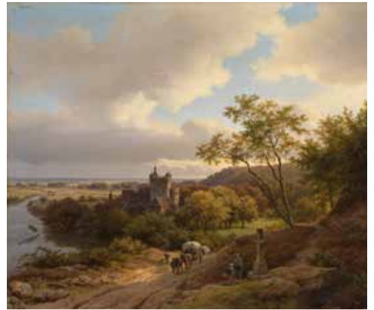
Een kasteel tussen bomen aan een rivier, 1845. Barend Cornelis Koekoek (1803 - 1862). Amsterdam Museum.