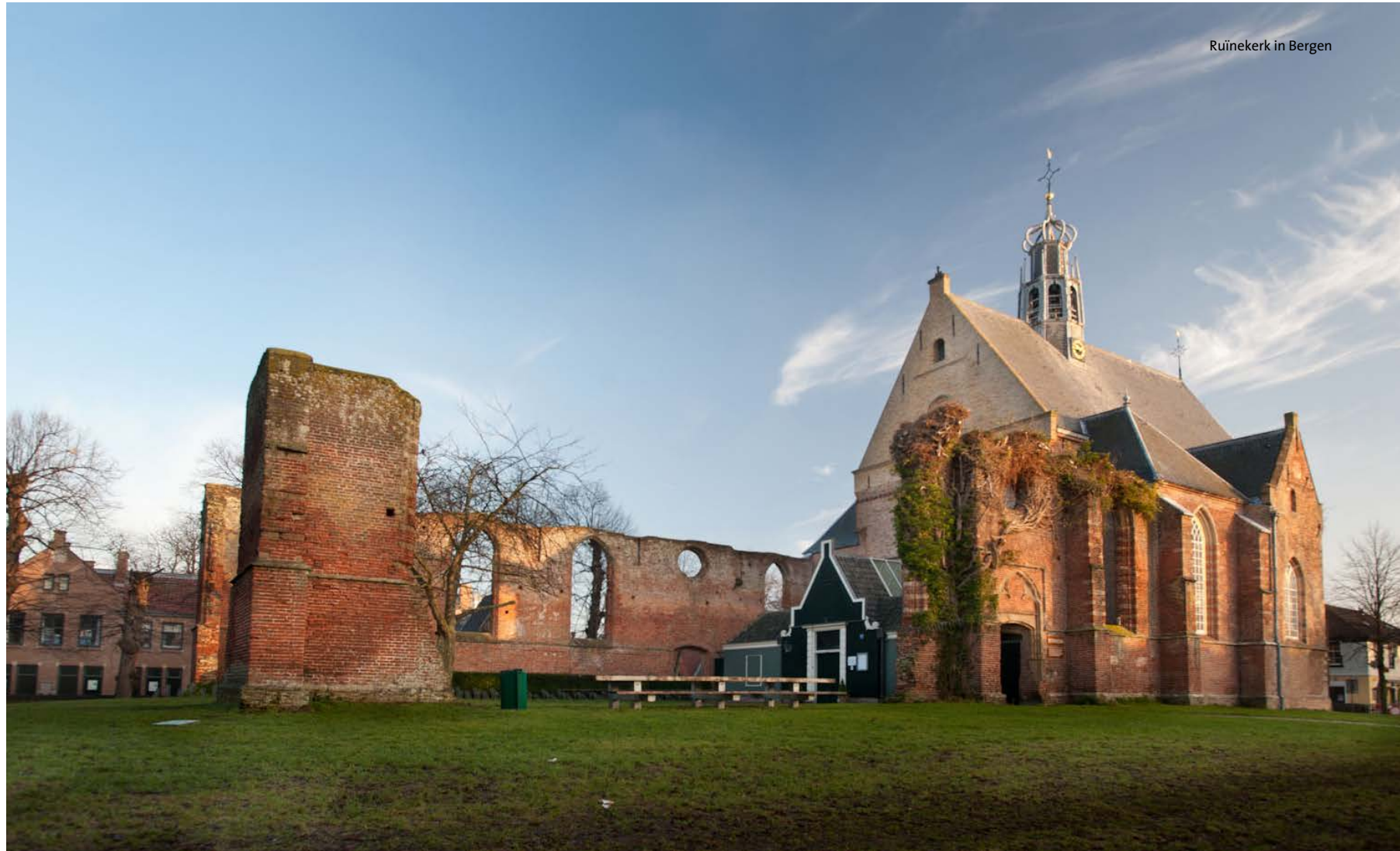
Ruïnekerk in Bergen

Routebeschrijving Vanaf Station Alkmaar gaat u, met uw rug naar het sta-