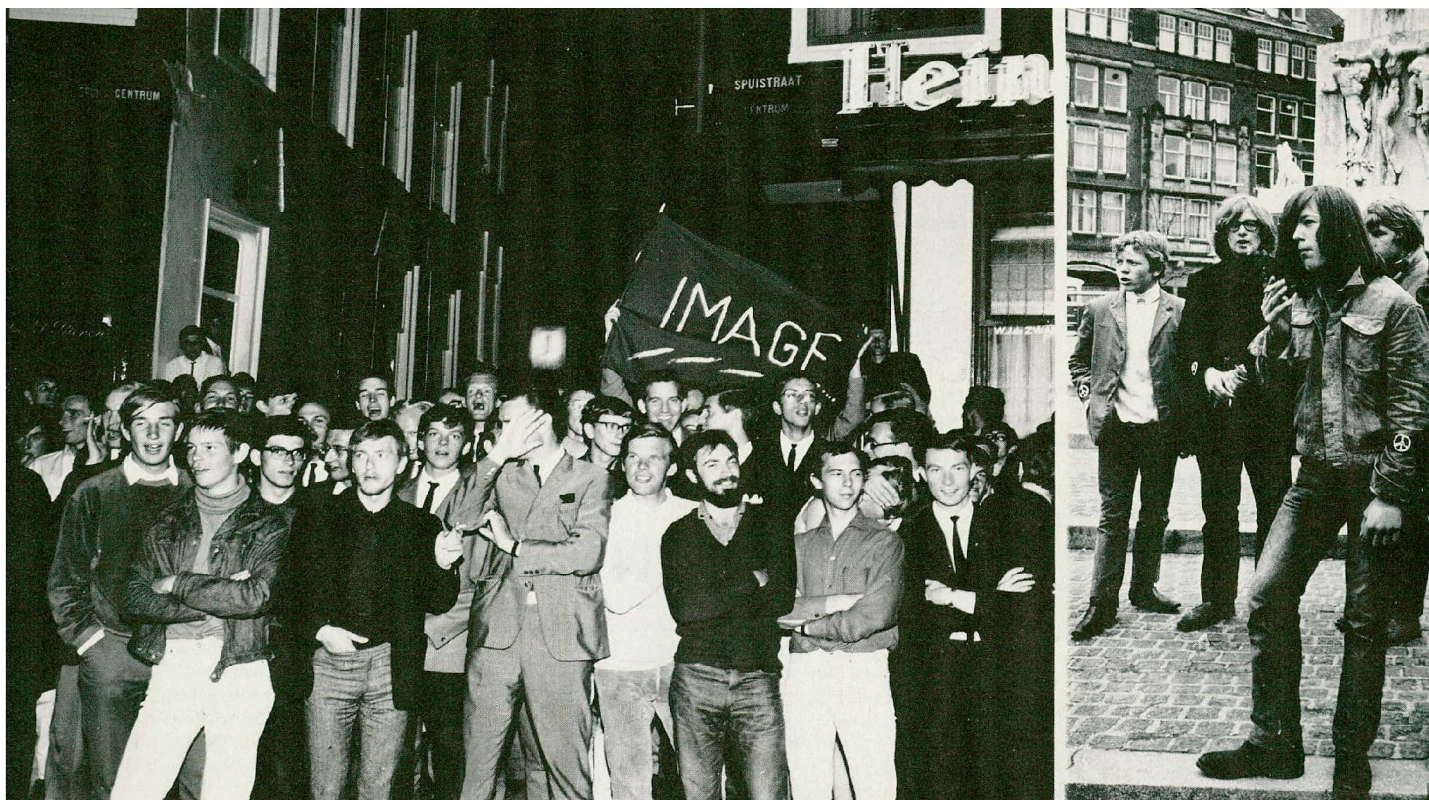
V.l.n.r.: Happening bij het Lieverdje, 1964; deelnemers stille mars tegen Amerikaans Vietnambeleid, 1966; rookbom op de Dam bij het huwelijk van prinses Beatrix en prins Claus, 1966