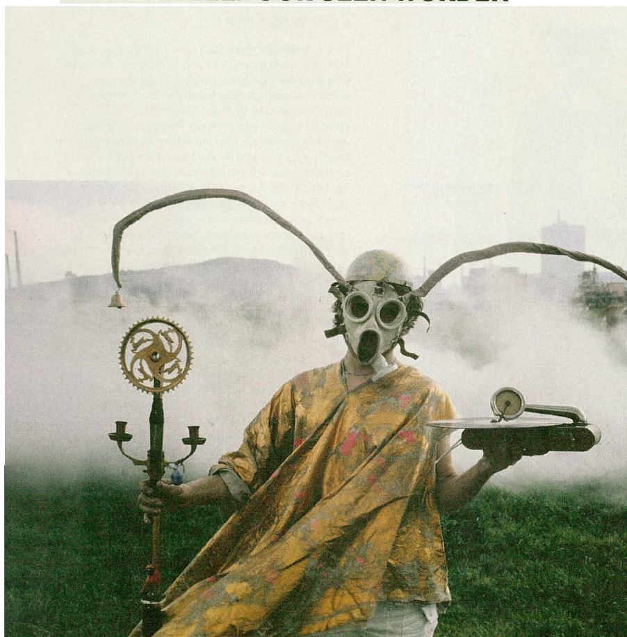
Vlinderopera van de Insektensekte, 1970