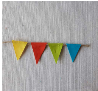
Stap 6: Lijm de eerste vier vlaggetjes met verschillende kleuren om en om aan het touw.