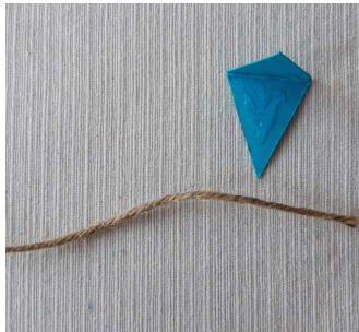
Stap 5: Plak een vlaggetje met lijm aan het touw.