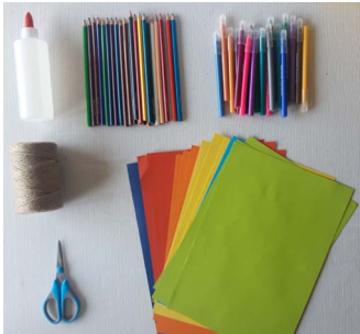
Stap 1: Leg alle benodigheden klaar.

Door het coronavirus kunnen we niet meer bij vrienden of familie langs en missen van alles, zoals verjaardagen. Wil je iemand alsnog verrassen met een leuke kaart? Maak dan een eigen verjaardagskaart en stuur deze op naar de jarige!