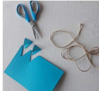
Stap 3: Vouw een ander gekleurd A4'tje dubbel. En knip driehoekjes uit de gevouwen rand.