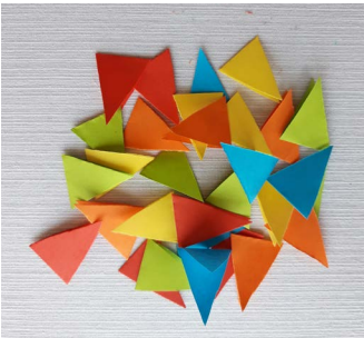
Stap 4: Herhaal stap 3 met verschillende kleuren papier.