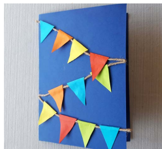
Klaar? De kaart is nu af! Je hebt een feestelijke kaart gemaakt. Schrijf een leuk berichtje in de kaart en verstuur het met de post.