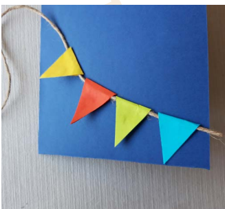
Stap 7: Plak de slinger zigzag over de kaart.